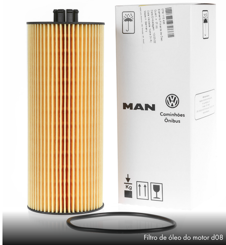
Filtro de óleo do motor d08