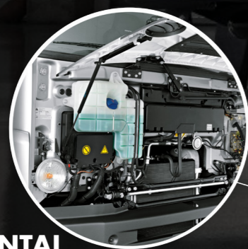
GRADE FRONTAL ABERTA

acidentados, e a exclusiva função Rock in Free, criada especialmente para este modelo e que ajuda a vencer obstáculos como, por exemplo, um atolamento. O novo motor MAN D26 de última geração, agora produzido no Brasil, possui 460 CV com 2.300 NM com uma ampla faixa de torque plano. O novo motor D26 garante máxima performance. A transmissão de 12 marchas ZF Traxon automatizada, com a opção de 16 marchas, ambas preparadas para a operação off-road, garante a melhor performance para aguentar o tranco. O Constellation 33.460 foi feito sob medida para grandes desafios. A frente do modelo possui ângulo de ataque mais alto e acentuado, para-choque metálico para suportar operações severas e grades protetoras nos faróis. As lanternas traseiras de LED, mais visíveis à noite e em situações de chuva e neblina, aumentam a segurança da viagem. O novo cavalo mecânico da VW conta, ainda, com eixos traseiros com redução nos cubos e suspensão metálica reforçada.