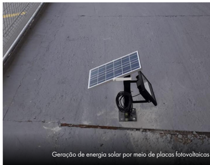
Geração de energia solar por meio de placas fotovoltaicas