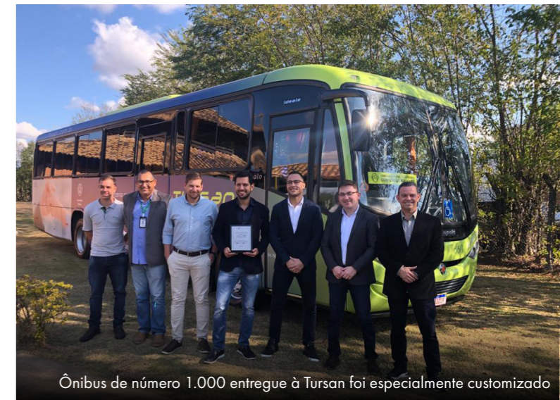
Ônibus de número 1.000 entregue à Tursan foi especialmente customizado

A Volkswagen – Caminhões e Ônibus realizou no dia 4 de agosto um evento especial em comemoração ao milésimo ônibus entregue pela empresa desde sua fundação. A Tursan, empresa de fretamentos e cliente da VW há mais de 20 anos, recebeu o veículo de número mil na fábrica de Resende (RJ), ocasião na qual ocorreu ainda a celebração de aniversário de 60 anos da Tursan.