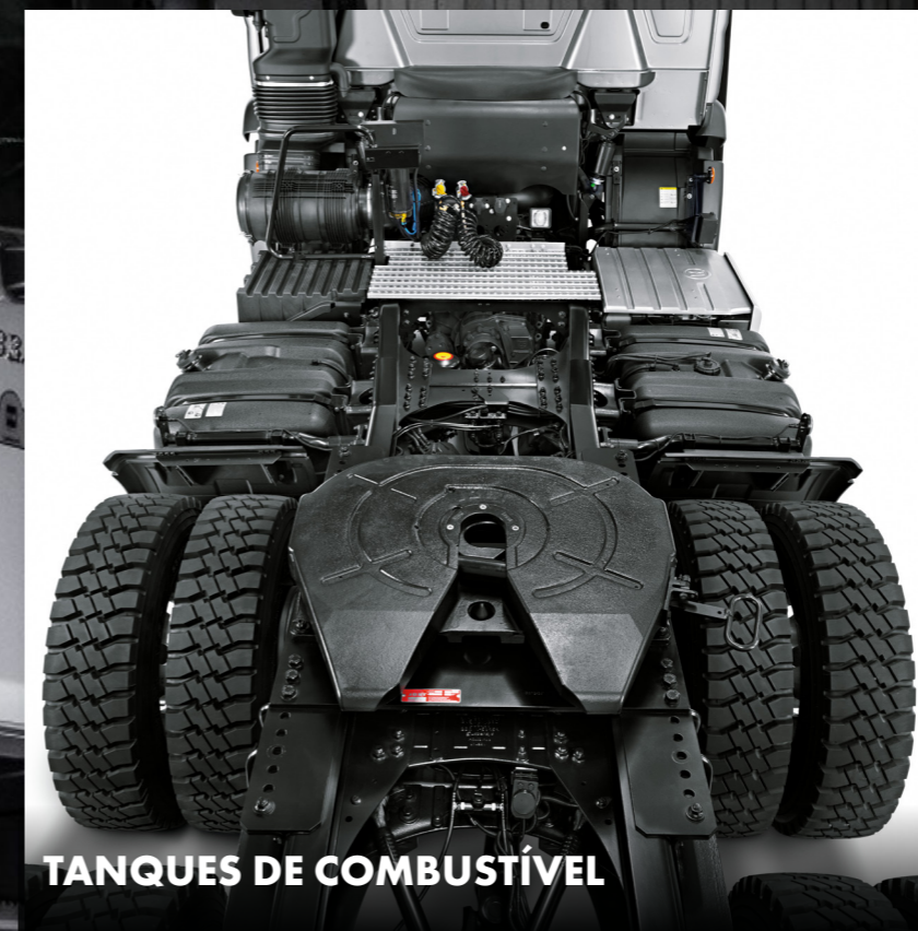
TANQUES DE COMBUSTÍVEL