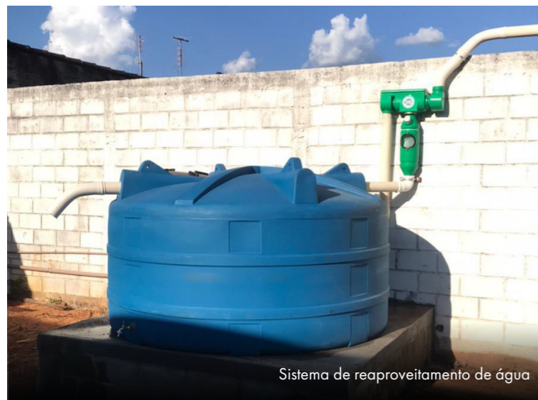
Sistema de reaproveitamento de água