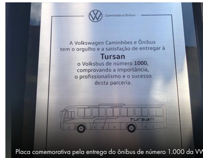
Placa comemorativa pela entrega do ônibus de número 1.000 da VW

O ônibus de número mil, cujo modelo é o 17.230 ODS, foi customizado especialmente para a ocasião e faz parte de um lote de 80 Volksbus adquiridos neste ano pela Tursan e faturados pela Transrio Resende. Estiveram presentes no evento do dia 4 de agosto representantes da Volkswagen – Caminhões e Ônibus e da Tursan. Além do ônibus de número mil customizado, houve a entrega simbólica da chave VW e de uma miniatura do veículo.